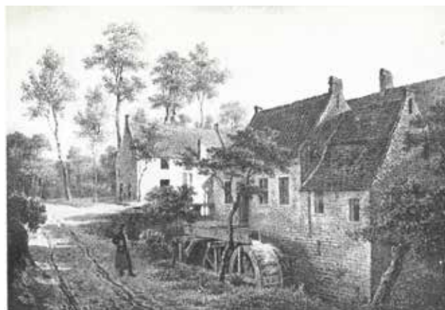
Lithographie de Boens

om ter hoogte van de Orteliusstraat een bocht te nemen naar de Pacificatiestraat. Met een bruggetje aan de Leuvensesteenweg (Sint-Joostplein) langs de Sint-Joostkerk, door de Sint-Jooststraat, de