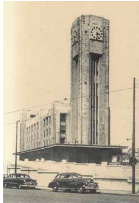
Het nieuwe Noordstation (1949-1952). Noordplein, Sint-Joost-ten-Node