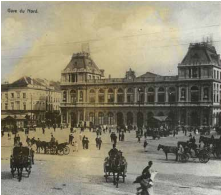
Het eerste Noordstation, afgebroken in 1956. Rogierplein, Sint-Joost-ten-Node.