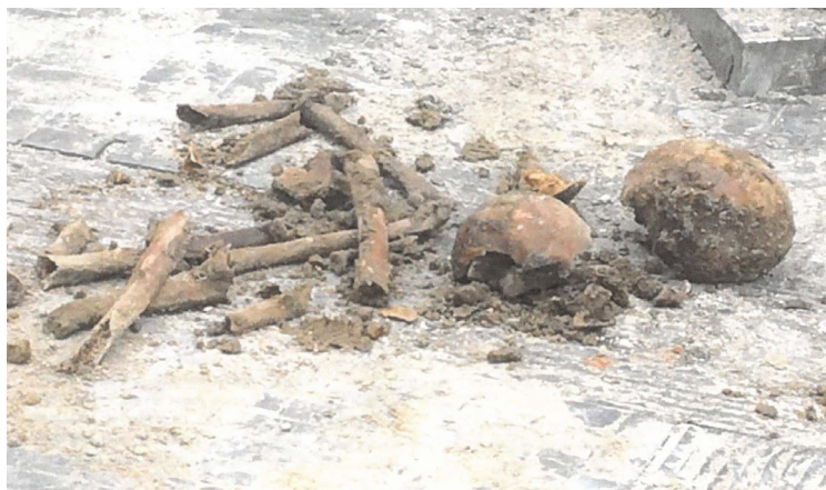
30 augustus 2021. Botten ontdekt op het oude kerkhof.

Sint-Joost-ten-Node werd in 1832 geteisterd door een hevige cholera-epidemie. Die zich in 1849 herhaalde, en nog heftiger was dan de vorige. Vele slachtoffers werden verzorgd in een lazaret in de Kunststraat, ondertussen de Liefdadigheidsstraat geworden. Een naam die ons herinnert aan de vele bewoners die zich liefdadig hebben ingezet voor de verzorging. In die tijd waren de beken meestal een vuile open riool, waar alles in terecht kwam. Te Sint-Joost-ten-Node liep de Maalbeek vlak naast het kerkhof, in het centrum van het dorp, wat niet gunstig was voor zuiver water. De bevolking