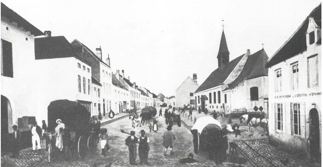
De oude Sint-Joostkerk rond 1863. Op de muur zien wij nog oude grafstenen.