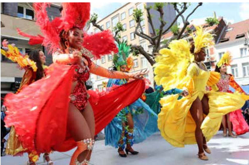
Carnaval in Sint-Joost-ten-Node