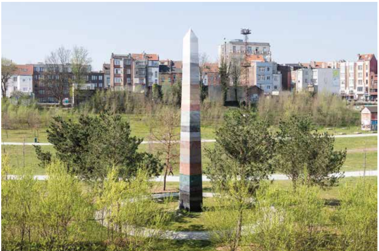
Op de Thurn & Taxis-site staat een grote obelisk met alle artikels uit de Universele Verklaring van de Rechten van de Mens. Die verklaring is nu 75 jaar oud.

De universele verklaring van de rechten van de mens spookt door mijn hoofd, 30 artikels in totaal. Ik neem de vrijheid om enkel de eerste 2 daarvan binnen uw gezichtsveld te schuiven. Artikel 1. Alle mensen worden vrij en gelijk in waardigheid en rechten geboren. Zij zijn begiftigd met verstand en geweten, en behoren zich jegens elkander in een geest van broederschap te gedragen.