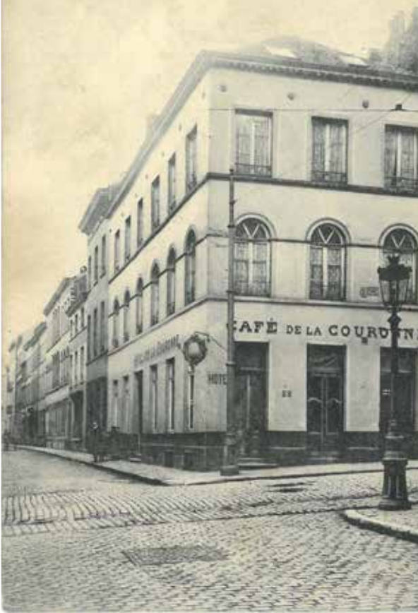
N° 6 Propriété de La Victoire — Eigendom der Victoire Bruxelles. Rue du Chemin de Fer, 22