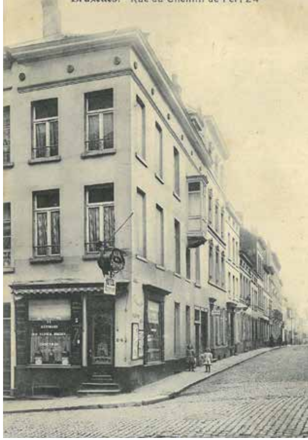
N° 7 Propriété de La Victoire — Eigendom der Victoire Bruxelles. Rue du Chemin de Fer, 24